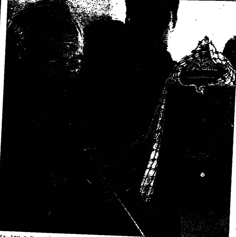
الرئيس الفلسطيني والوزير الاوروبي انجل موريتوس يجتهدان للمصالح بعد اجتماعهما امس في مكتب الرئيس عرفات في غزة (دعوات)